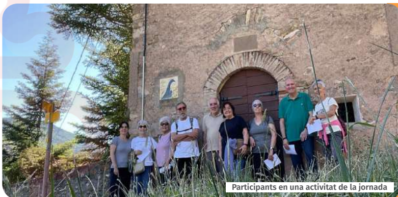
Participants en una activitat de la jornada

Participació de les Càritas a 5 comissions de treball diocesanes