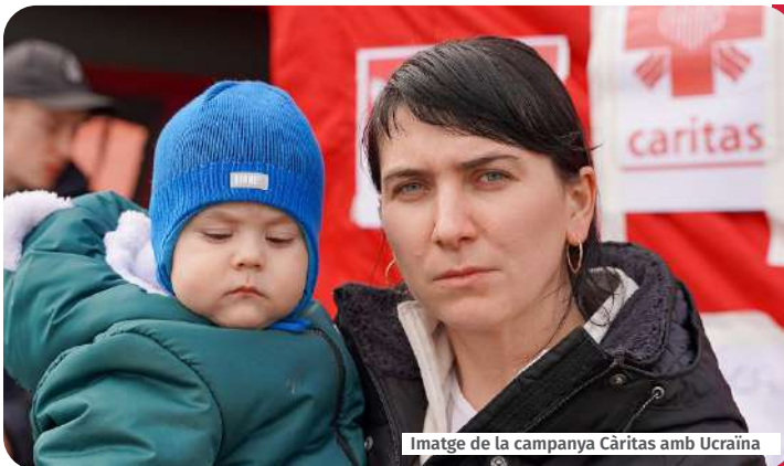
Imatge de la campanya Càritas amb Ucraïna

El Bisbat de Vic va canalitzar tota la seva ajuda material a través de Càritas Diocesana, en coordinació amb Càritas Nacional d'Ucraïna, Càritas Catalunya, Direcció General de Migracions de la Generalitat de Catalunya i altres entitats, com la Creu Roja, Accem i Cear.