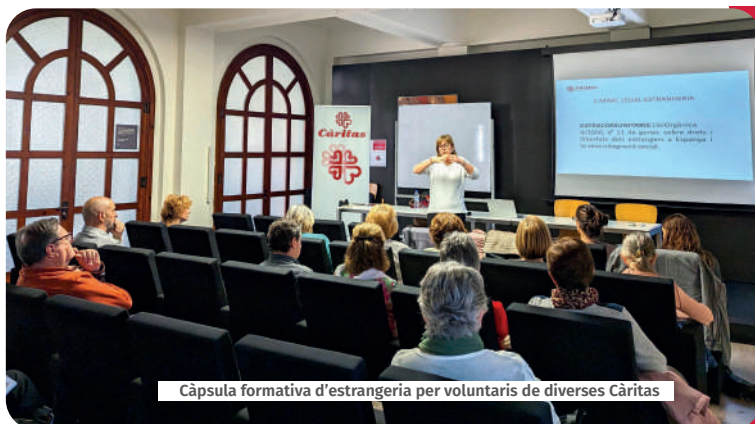
Càpsula formativa d'estrangeria per voluntaris de diverses Càritas

Les càpsules formatives d'estrangeria estan adreçades al voluntariat de Càritas i tenen com a objectiu oferir assessorament sobre els passos que han de seguir les persones migrades per tal de regularitzar la seva situació administrativa.