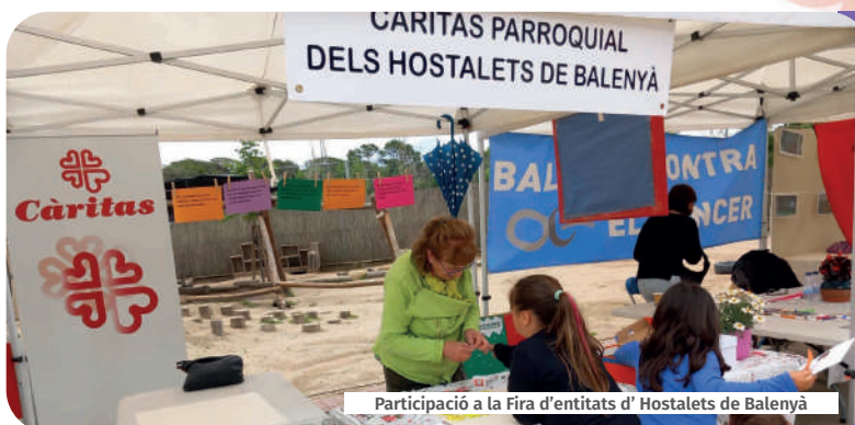
Participació a la Fira d'entitats d' Hostalets de Balenyà

Càritas participa en esdeveniments amb l'objectiu de sensibilitzar a la ciutadania i donar a conèixer les accions socials que duu a terme.