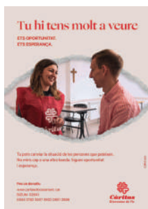
Tu hi tens molt a veure (Corpus) -Juny-