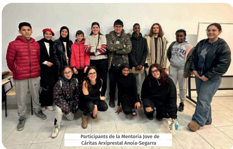
Participants de la Mentoria Jove de Càritas Arxiprestal Anoia-Segarra