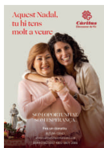
Som oportunitat, som esperança -Desembre-