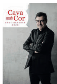
Cava amb Cor -Novembre-