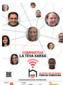
Ningú sense llar -Novembre-