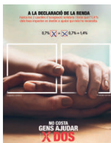
No costa gens ajudar per dos -Maig-